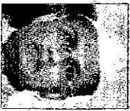
ಕಾಂಗ್ರೆಸ್ ಪಕ್ಷ ಒಟ್ಟು ಹೊರವರಿಗೆ ತೆಗೆ ಶಾಸಿ ಆಗಬೇಕು. ಹೀಗಾಗಿ ಸುಪ್ರೀಂ ಕೋರ್ಟ್‌ನಲ್ಲಿ ಅನರ್ಹ ಶಾಸಕರ ವಿರುದ್ಧ ಕೋರ್ಟ್‌ಗೆ ಮುಂದುವರಿಸುವೆ ಎಂದು ಕೆಪಿಸಿಸಿ ಅಧ್ಯಕ್ಷ ದಿನೇಶ್ ಗುಂಡೂ ರಾವ್ ಹೇಳಿದ್ದಾರೆ. ಚಿಂಗಳೂರಿನಲ್ಲಿ ಗುರುವಾರ ಸುದ್ದಿಗಾರರ ಜತೆ ಮಾತನಾಡಿದ ಅವರು, ಅಕ್ರಮವಾಗಿ ಈಗಾಗಲೇ ಪಕ್ಷದಿಂದ ಉಪ್ಪಾಟಿನ ಮಾಡಿವೆವೆ. ಅವರಿಂದಲಾಗಿ ರಾಜಿ ಮಾಡಿ ಕೊಳ್ಳುವ ಪ್ರಶ್ನೆಯೇ ಇಲ್ಲ ಎಂದಿದ್ದಾರೆ.

ಚಿಂಗಳೂರು: ಅನರ್ಹಗೊಂಡ ಶಾಸಕರಿಂದಲಾಗಿ ರಾಜಿ ಮಾಡಿ ಕೊಳ್ಳುವ ಪ್ರಶ್ನೆಯೇ ಇಲ್ಲ.